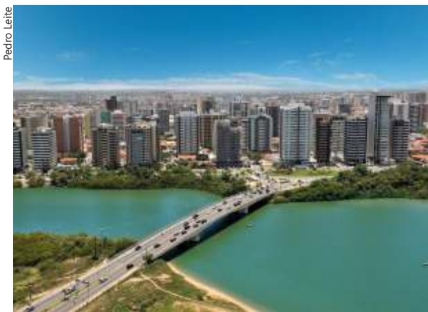
Visão aérea panorâmica da cidade de Aracaju (SE)

O XIX Encontro Nacional de Bacias Hidrográficas (ENCOB) já está com data marcada. A 19ª edição acontecerá na cidade de Aracaju (SE), de 7 a 10 de novembro. Realizado pelo Fórum Nacional de Comitês de Bacias Hidrográficas, o ENCOB visa promover o debate sobre os cenários atual e futuro da gestão de recursos hídricos no país.