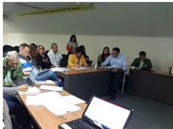
Representantes de Comitês em oficina realizada na cidade do Rio de Janeiro

Na ocasião, os Comitês presentes foram orientados em relação ao preenchimento da planilha de informações sobre os indicadores e as metas a serem atingidas ao longo dos cinco anos de execução do Programa.