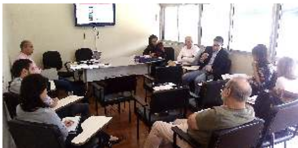
Participantes do GT discutem sobre o plano de trabalho do grupo

No dia 11 de julho, a fábrica de cimento da Votorantim assinou um termo de compromisso com o Ministério Público do Estado do Rio de Janeiro (MPRJ). No termo, a cimenteira comprometeu-se a adotar medidas para a proteção do meio ambiente no distrito de Euclidelândia, no município de Cantagalo (RJ), onde está localizada.