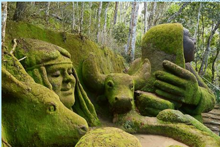
As maravilhosas esculturas naturais de Nêgo