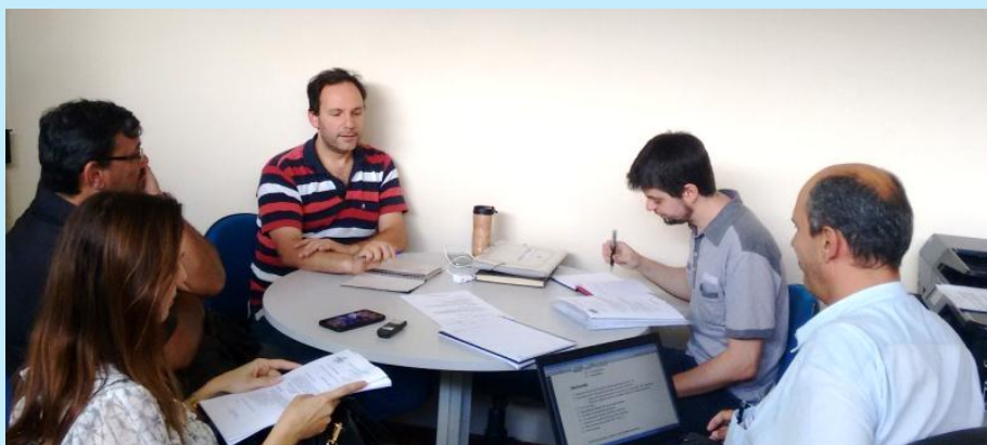
Primeira Reunião Ordinária do Diretório

O CBH Rio Dois Rios realizou no dia 17 de fevereiro de 2017, sexta-feira, a 1ª Reunião Ordinária do Diretório (1ª ROD). A reunião aconteceu no escritório da AGEVAP UD3, sede do CBH Rio Dois Rios, no Centro de Nova Friburgo, Rio de Janeiro, e contou com a presença de três membros da Diretoria e como convidado, um membro da Câmara Técnica, além da equipe AGEVAP UD3. Na reunião, foi aprovada a ata da 4ª ROD e discutiu-se sobre a minuta da Resolução CBH-R2R nº 051/2017, que dispõe sobre a disponibilização dos recursos dos Comitês MPS, R2R, Piabanha e PSI para custeio da AGEVAP em situação extrema e em caráter emergencial. Além disso, discutiu-se sobre o PAP 2018-2022, transição de gestão, reunião entre CBH-R2R x AGEVAP, programa de residência técnica do Rio Dois Rios, sobre a elaboração da pauta da 33ª Reunião Ordinária do Plenário (22/02/17) e também a respeito da solicitação de repasse de recursos para projetos.