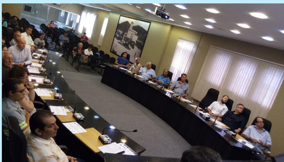
Posse dos membros na 33ª Reunião Ordinária do Plenário

Foi realizada no dia 22 de fevereiro de 2017, a 33ª Reunião Ordinária do Plenário do CBH Rio Dois Rios (33ª ROP). O evento aconteceu no Plenário da Câmara Municipal de Nova Friburgo e contou com a presença de 41 pessoas entre membros e convidados. O principal ponto de pauta foi a posse dos membros da composição do Plenário e da respectiva Diretoria para o biênio 2017-2018. O evento ocorreu com base nas diretrizes estabelecidas no Fórum Eleitoral do CBH Rio Dois Rios, realizado em 14 de fevereiro de 2017, no Espaço Ambiental das Águas de Nova Friburgo – ETE Olaria.