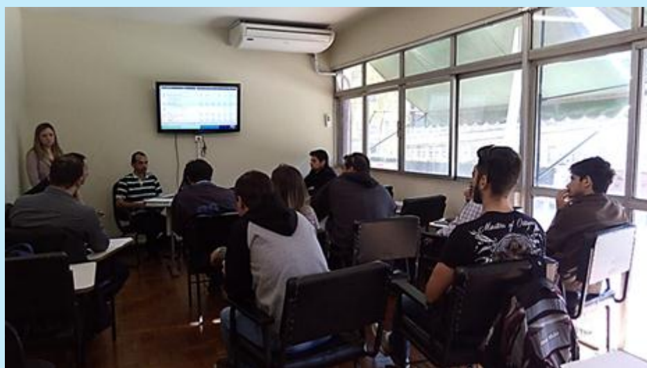
Membros da Câmara Técnica do CBH Rio Dois Rios se reúnem em 3ª reunião do ano

No dia 27 de julho, a Câmara Técnica Permanente Institucional e Legal do CBH Rio Dois Rios realizou sua 3ª Reunião Ordinária. O evento, sediado no auditório da Superintendência Regional de Dois Rios do Instituto Estadual do Ambiente (SUPRID/INEA), teve como pauta a aprovação da ata da 2ª ROCT; a análise de projetos do CBH: Residentes, Laboratório das Águas e Diagnóstico; a análise da minuta da Resolução CBH-R2R nº 52/2017 - PAP 2018-2022; o plano de trabalho do Especialista de Recursos Hídricos e os informes sobre a Campanha CNARH, PROCOMITÊS e capacitação SIGA-CEIVAP. A reunião contou com a presença de 14 pessoas, dentre membros e convidados.