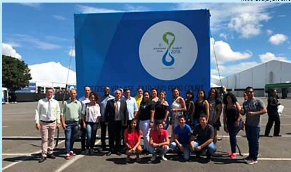
Comitiva de Trajano de Moraes em Brasília

O maior evento global sobre a temática da água, o 8º Fórum Mundial da Água (FMA) foi realizado em Brasília cheio de gás e energia. O município de Trajano de Moraes levou a temática do Projeto Experimental de Monitoramento Participativo dos Corpos Hídricos, denominado “Rio Macabu em ação: história, conhecimento e vida. Mais de 20 pessoas entre gestores públicos, professores, diretores, alunos e técnicos do município, viajaram mais de 24 horas para participar do evento.