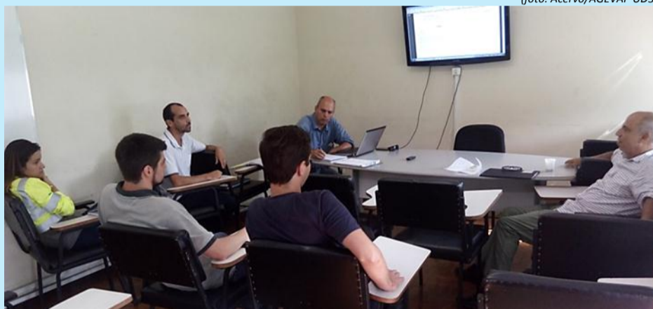
Diretores e presidente do CBH Rio Dois Rios reúnem-se em Nova Friburgo

Foi realizada, no dia 22 de fevereiro, a 1ª Reunião Ordinária do Diretório do CBH Rio Dois Rios (1ª ROD) de 2018. O evento aconteceu no auditório da SUPRID/Inea Rio Dois Rios, em Nova Friburgo, e contou com a presença do presidente e mais três diretores, além da equipe da AGEVAP UD3.