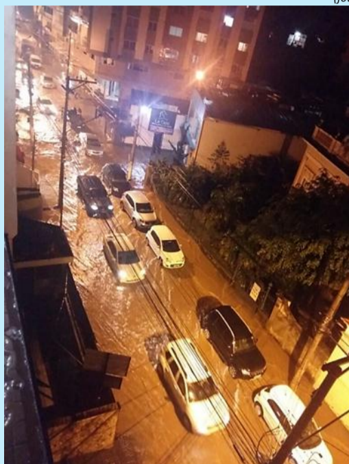
A esquina das ruas Augusto Spinelli e Farinha Filho alagada

A Defesa Civil Municipal interditou duas casas no Catarcione e em Centenário, no distrito de Campo do Coelho, afetadas pelas chuvas que caíram sobre Nova Friburgo no fim da tarde e à noite desta quinta-feira, 22. Nove pessoas estão desalojadas e receberam apoio da Secretaria de Assistência Social. Não há desabrigados. Pelo menos 17 linhas de ônibus tiveram os itinerários afetados pela chuva, segundo a Faol.