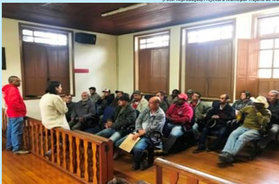
Encontro para ficar na história de Trajano de Moraes