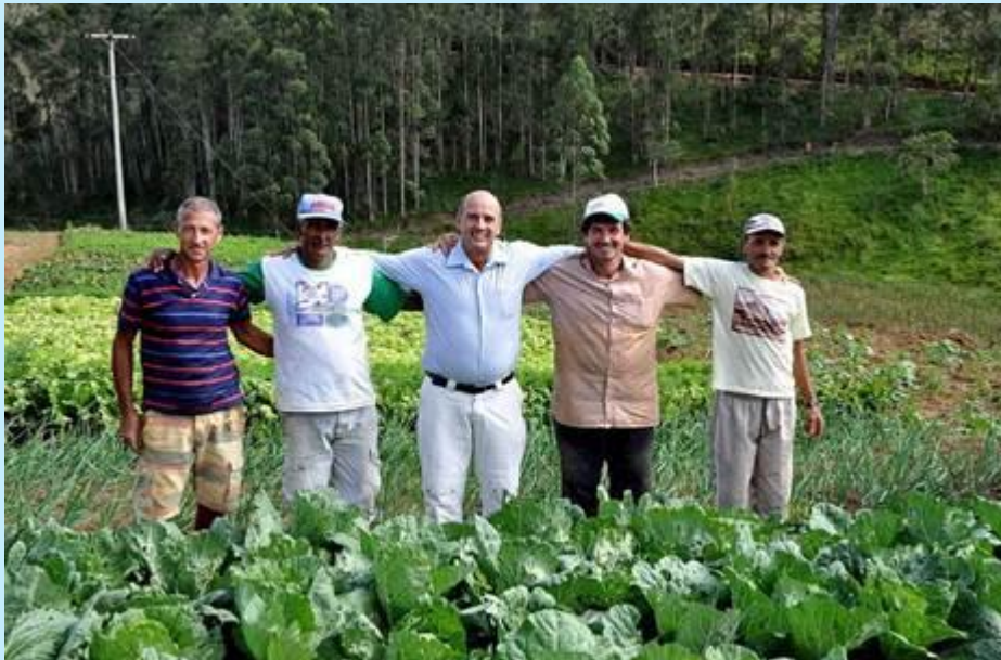
O Secretário de meio ambiente junto com os agricultores

A Secretaria de Agricultura está produzindo legumes, verduras e frutas na fazendinha ecológica, localizada no horto municipal do município de Duas Barras/RJ, e distribuindo, desde o mês de maio, no hospital, escolas, lar social e demais instituições. O Secretário da pasta organizou um espaço destinado a visitação de estudantes para que possam realizar aulas-passeios, desfrutando de informações relacionadas ao meio ambiente, com uma estrutura apropriada para receber os alunos e professores.