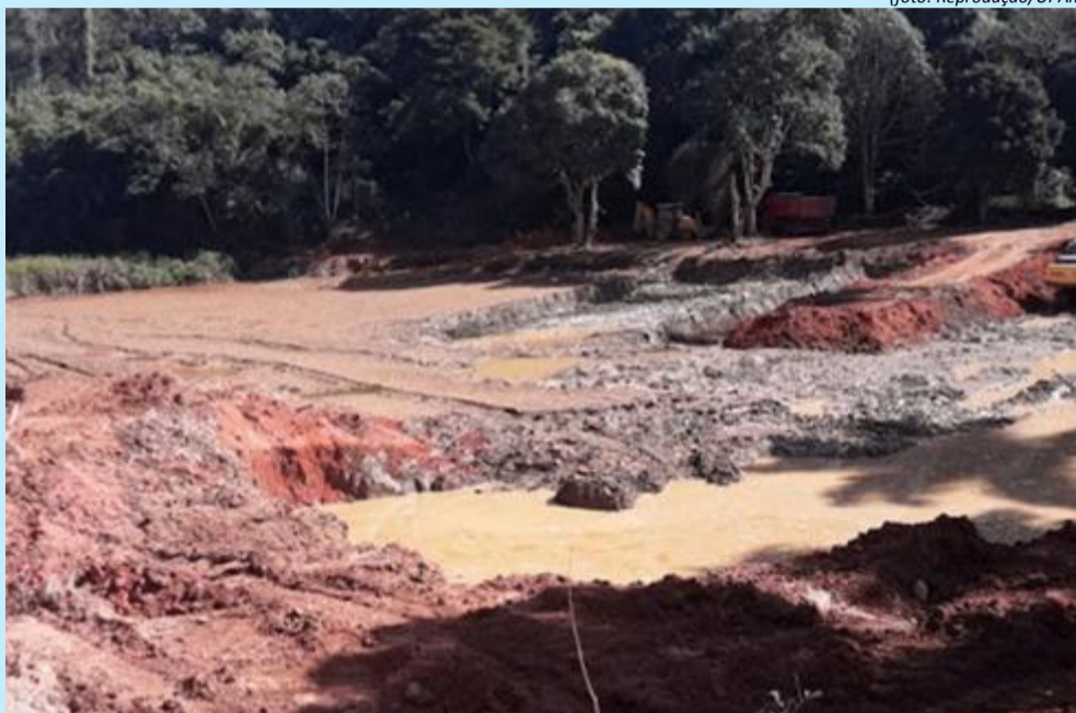
Ampliação de açude foi flagrada em Macuco/RJ

Três homens foram detidos no dia 28 de julho, em uma fazenda na RJ-172, zona rural de Macuco, região serrana do Rio de Janeiro. Segundo policiais da Unidade de Policiamento Ambiental (UPAm), os homens faziam obras para ampliar um açude e abrir uma estrada de 50 metros de comprimento no local. Ainda de acordo com a UPA, o trabalho causou a redução de vegetação nativa.