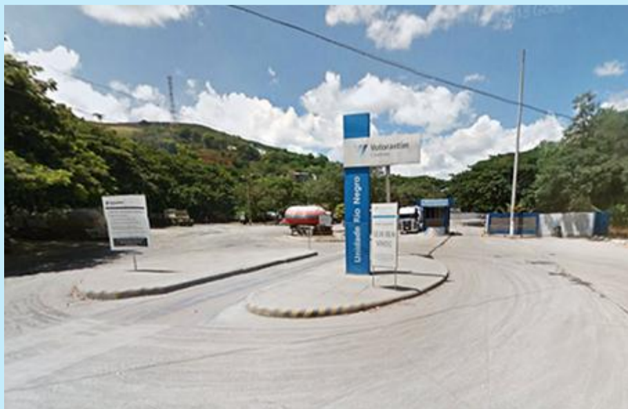
Entrada da fábrica de cimento da Votorantim em Cantagalo

No dia 11 de abril, a fábrica de cimento da Votorantim, em Cantagalo, assinou o termo de compromisso com o Ministério Público do Estado do Rio de Janeiro (MPRJ) para a proteção do meio ambiente no distrito de Euclidelândia. A divulgação, porém, aconteceu no dia 22 e foi noticiada pelo jornal A Voz da Serra. A Votorantim responsabilizou-se pela criação de um Grupo de Trabalho, com a participação do Comitê de Bacia Hidrográfica do Rio Dois Rios (CBH-R2R) e do Instituto Estadual do Ambiente (INEA) para elaborar medidas visando a qualidade ambiental da região. Dentre as deliberações propostas pelo Grupo de Atuação Especializada em Meio Ambiente (Gaema), a fábrica vai reutilizar a água na produção de sua matéria e aperfeiçoar o monitoramento da emissão de gases poluentes.