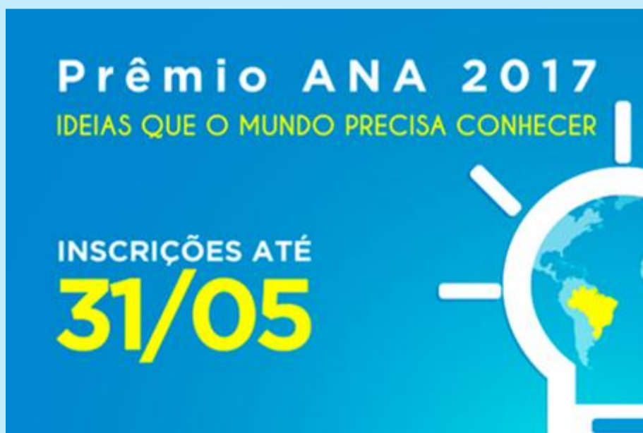
O Prêmio ANA é uma ação que reconhece trabalhos os quais contribuem para a gestão e o uso sustentável dos recursos hídricos do País

A Agência Nacional de Águas (ANA) abriu as inscrições para a 6ª edição do Prêmio ANA, até 31 de maio. O concurso é voltado para trabalhos na área de gestão e uso de recursos hídricos no Brasil. Em 2017, os interessados podem inscrever-se em nove categorias, sendo elas: Empresas de Micro e Pequeno Porte; Empresas de Médio e Grande Porte; Pesquisa e Inovação Tecnológica; Organizações Cívicas; Imprensa (impressos e sites); Imprensa (rádio); Imprensa (TV); Ensino e Governo.