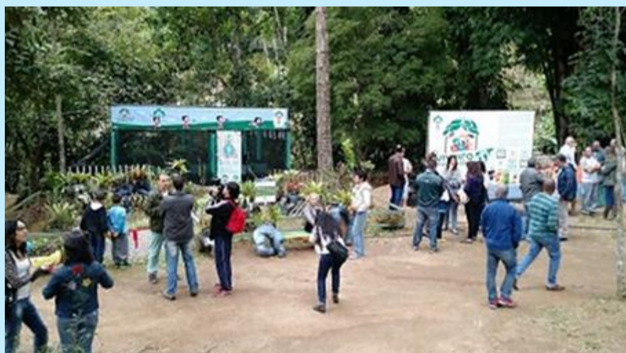
Evento reúne visitantes no Parque Municipal de Nova Friburgo