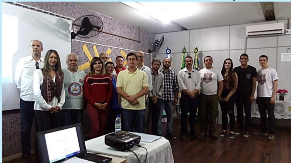
Participantes da reunião de apresentação do PROTATAR posam para foto oficial

O Comitê Rio Dois Rios realizou, no dia 11 de agosto, uma reunião de apresentação do Programa de Tratamento de Águas Residuárias - PROTATAR. Na reunião, ocorrida no auditório da Secretaria Municipal de Educação da cidade de Cantagalo (RJ), foi explicado, de maneira detalhada, o Edital do programa com o objetivo de tirar dúvidas dos municípios interessados no projeto. Estiveram presentes no encontro as prefeituras municipais de Santa, Maria Madalena, Cordeiro, São Fidélis, Trajano de Moraes, Itaocara, Duas Barras e Cantagalo, todas pertencentes a área hidrográfica do Comitê.