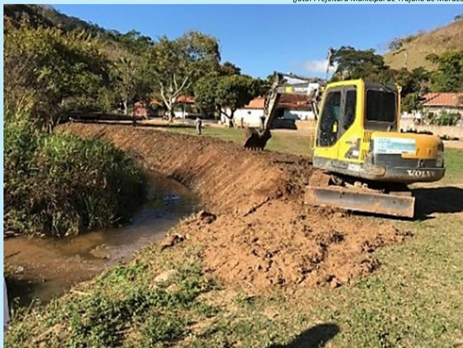
Máquina do Programa Limpa Rios