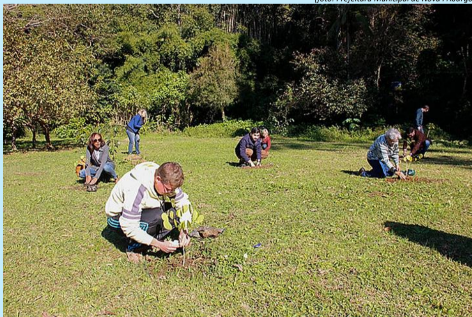
A primeira região a ganhar árvores foi a Via Expressa