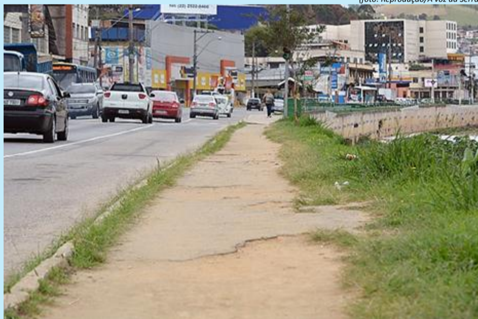
Inea vai construir trecho do Bengalas sem calçada

O Instituto Estadual do Ambiente (Inea) informou nesta terça-feira, 12, que vai concluir o trecho sem calçada e grades de proteção, às margens do Rio Bengalas, na altura do Prado, no distrito de Conselheiro Paulino, onde um homem caiu na última semana. O órgão informou que vai realizar obras no leito do rio no trecho do Colégio Rui Barbosa até o loteamento dos Maias. O projeto executivo já foi concluído e aguarda liberação do Ministério das Cidades.