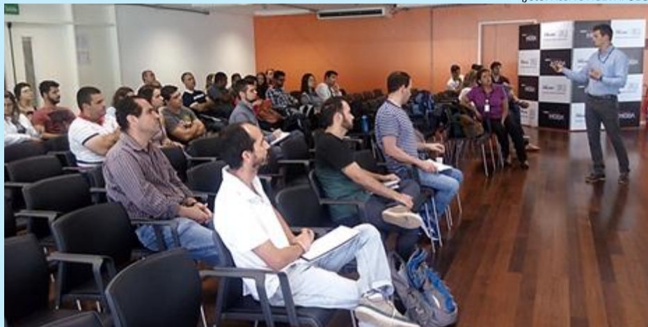
Momento da capacitação no CNARH 40 durante a oficina

O Comitê de Bacia Hidrográfica Rio Dois Rios realizou no dia 7 de dezembro, em parceria com o Instituto Estadual do Ambiente (Inea), a Oficina de Capacitação em Cadastramento e Regularização do Uso de Recursos Hídricos. O objetivo foi capacitar parceiros institucionais que aderirem ao projeto de Cadastramento promovido pelo CBH-R2R visando ao aumento do número de cadastrados da bacia no Cadastro Nacional de Usuários de Recursos Hídricos (CNARH).