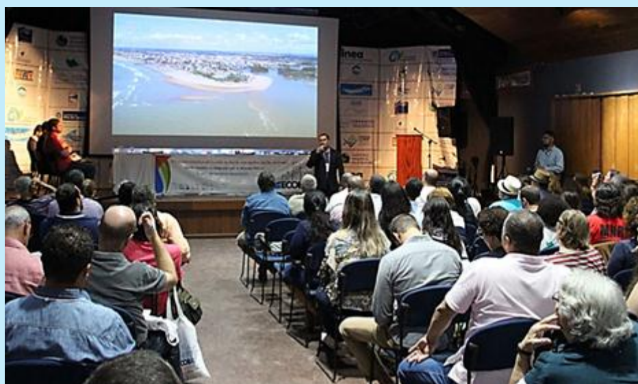
V Encontro Estadual de Bacias Hidrográficas do Rio de Janeiro (ECOB/RJ)

De 28 à 30 de agosto, a cidade de Paraty recebeu o V Encontro Estadual de Bacias Hidrográficas do Rio de Janeiro (ECOB/RJ), realizado na Casa da Cultura do município. Com o tema “Gestão Costeira e a Integração com os Recursos Hídricos”, o evento teve a participação de aproximadamente 300 pessoas, entre elas, os membros dos CBHs Baixo Paraíba do Sul e Itabapoana, Piabanha, Médio Paraíba do Sul, Guandu, Baía da Ilha Grande, Baía de Guanabara, Macaé e Rios das Ostras, Lagos São João e do Comitê Federal, o CEIVAP.